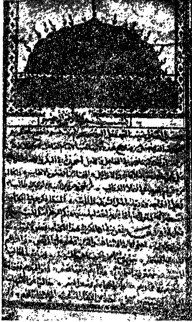
صورة الصفحة الأولى من النسخة الخطية (للأب أنستاس الكرملبي) في مكتبة دار الآثار القديمة - بغداد - ويرجع عهد كتابتها إلى عام ١١٠٥ وقد قوبلت هذه النسخة المطبوعة عليها